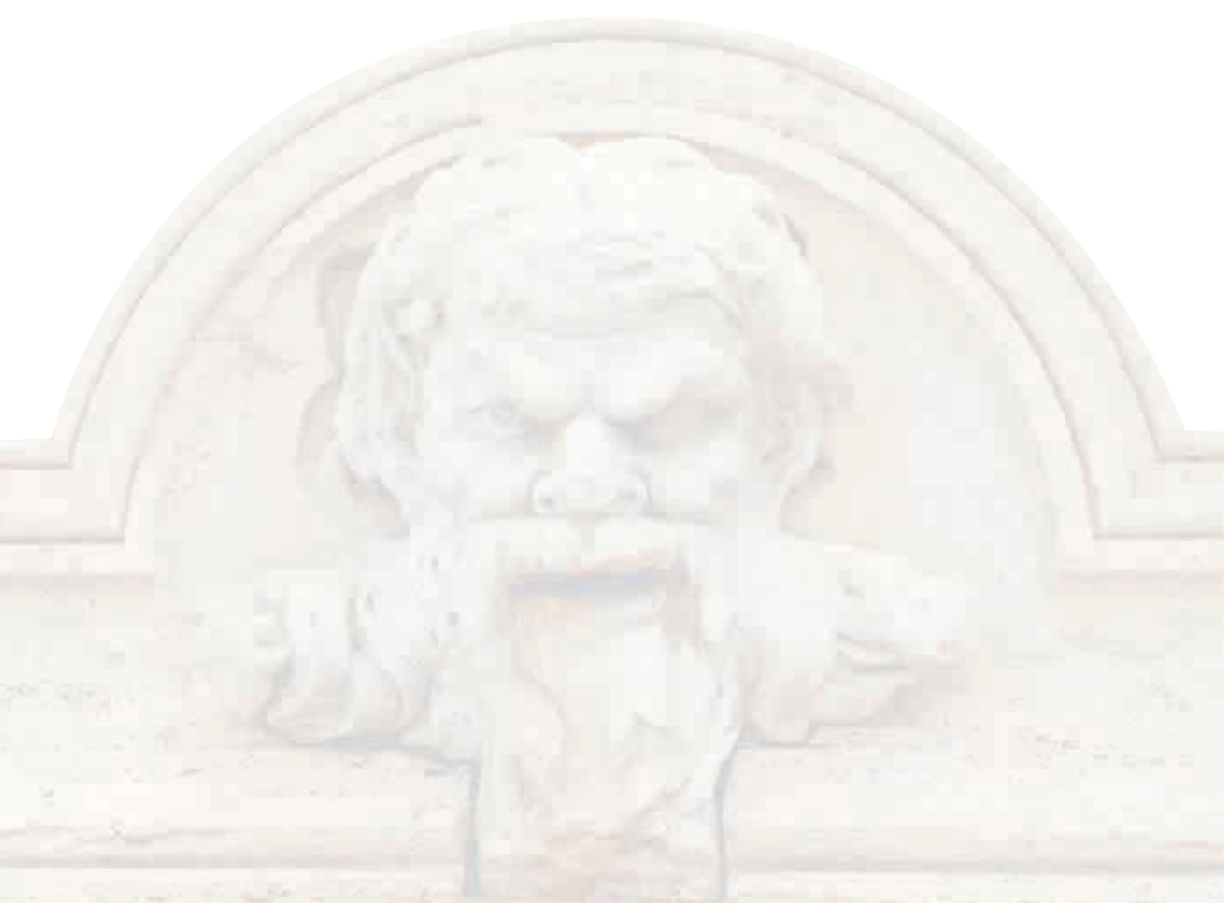
Foto in copertina: Arsenale Navale progettato da Gianlorenzo Bernini nel 1659.